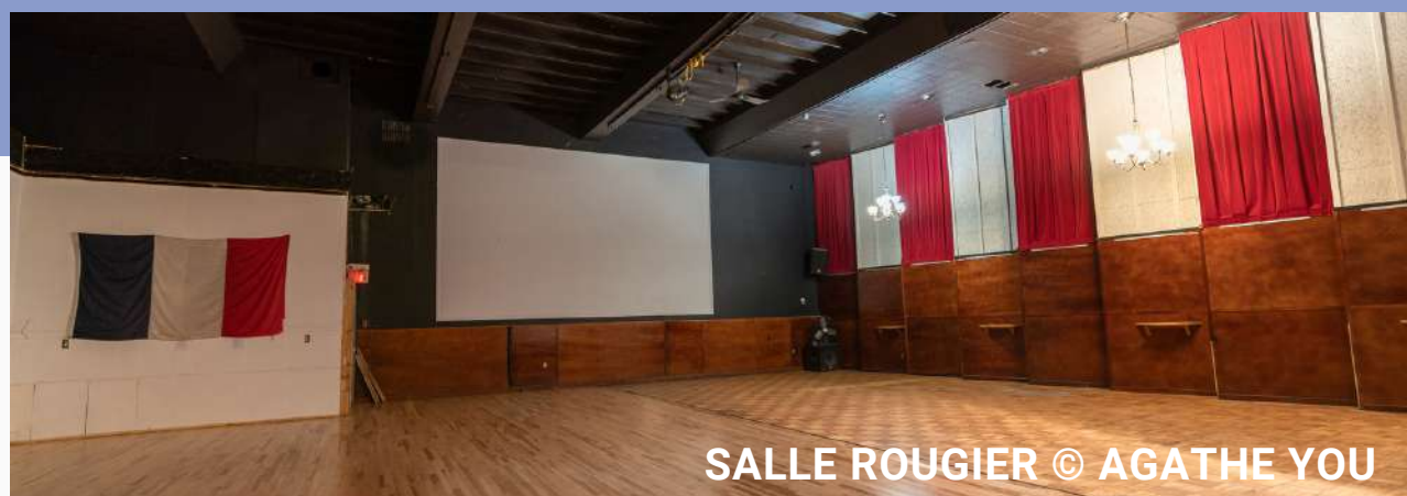
SALLE ROUGIER